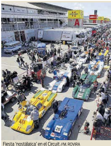
Fiesta 'nostálgica' en el Circuit //M. ROVIRA

El Circuit de Barcelona abre la temporada este fin de semana con el ‘Espíritu de Montjuïc’, el evento que revive las míticas carreras de los años dorados. Los nostálgicos están de enhorabuena ya que después de tres años, el certamen histórico vuelve con fuerza y un programa deportivo de primer nivel. Durante tres días de competición tendrán protagonismo campeonatos como el Masters Racing Legends, con monoplazas de F1 de 1996 a 1985; o el Masters Endurance Legends, con GT, turismos y prototipos del WEC e IMSA de 1995 a 2016. Tampoco faltará a la cita el Iberian Historic Endurance, con turismos, GT y prototipos de 1965 a 1976. Un gran espectáculo.