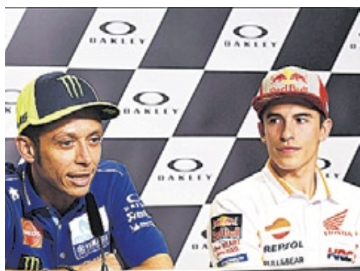
Márquez y Rossi, en la rueda de prensa de Mugello

vera nunca ha sido bien recibido por en casa de Rossi y tras el último incidente con ‘il dottore’ en Argentina ya cuenta que este año le van a abuchear con ganas. Él le quita importancia: “¿El ambiente de Mugello? Taponos para los oídos, casco, pista y listos”, afirma.